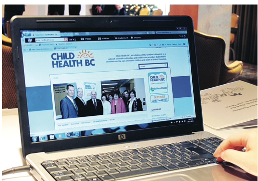
病童及他們的家人可從網站下載新資料冊或獲取有關糖尿病的最新信息。