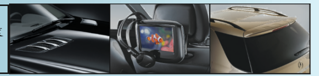
鍍鉻車頭蓋通風裝飾 後座多媒體娛樂系統 車尾擾流器

平治汽車「家家有平治」優惠計劃為閣下提供駕駛2011年款B系AVANTGARDE EDITION, C, ML系AVANTGARDE EDITION和GLK系最好時機，除首三月免供款/月租外，選購及安裝各項原裝平治後加配備更有25%折扣，B系及ML系各款前衛型號更為閣下提供分別超過$900及$3000免費配置，一個前所未有的優惠計劃，為免向隅，請即到大溫各平治陳列室試車選購。