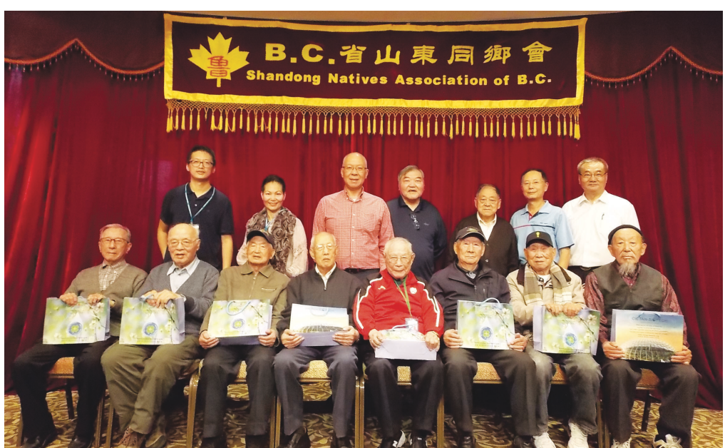
山東同鄉會重陽敬老 山東同鄉會重陽節前夕舉辦第十一屆敬老日活動，席開14桌，近140位耆英會員及其親屬歡聚一堂。8位超過90歲的耆英永久會員當選為本次活動的老壽星，獲贈價值上百元的營養品，圖為長賀科技范雪晏副總裁(左2)和可禮理事長(左3)及理事、義工與老壽星合影。

溫市中心商業促進會表示，相信拆除高架橋可以推動溫哥華市基礎設施建設，給市中心注入新動力。