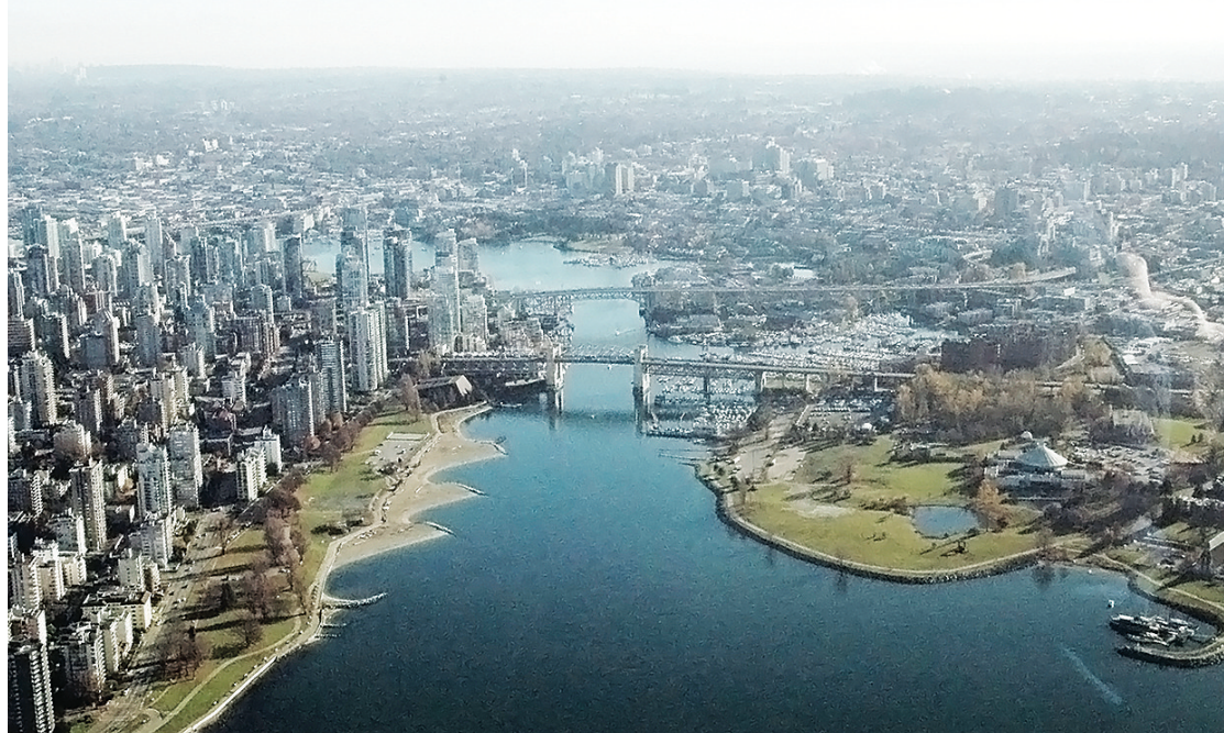
大溫樓市連續 4 個月成交超過 3000 宗。

大溫地區上月共有 1,322 間獨立屋成交，比去年同期的 1,249 間增加 5.8%，獨立屋基準價為 98.05 萬元，比去年同期上漲 6.5%。柏文成交量則為 1,212 間，比去年同期的 1,210 間略增 0.2%，柏文基準價為 37.65 萬元，比去年同期上漲 2.2%。在城市屋方面，上月成交量為 527 間，比去年同期的 487 間增加 8.2%。城市屋基準價為 47.24 萬元，比去年同期上漲 3.4%。