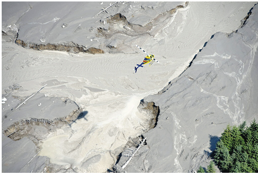
含有毒物質的污水，周一凌晨從珀利山尾礦池噴出，可能會引發生態危機。