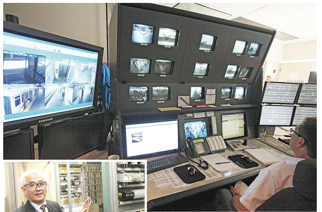
▲架空列車的控制室嚴密監控各車站以及列車運行情況。

慣減低患癌風險，內容包括日常飲食和運動、煙草和酒精、環境因素及癌症檢查。查詢請電604-836-6423(梁先生)，或瀏覽 http://richmondprostate.blogspot.ca/ 。