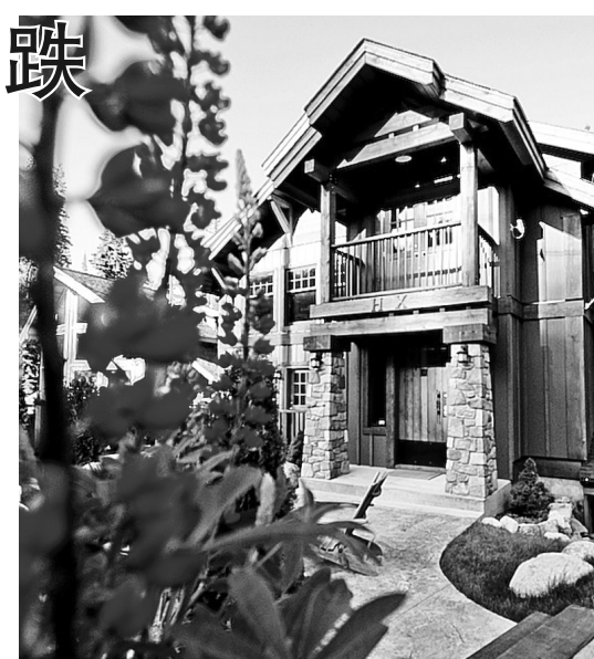
這間在南奧肯那根的度假房屋，金融危機後，價格下跌四分之一。

也會有中國移民到卑詩內陸，投資度假房屋。根據卑詩房地產協會（BCREA）的統計，主要度假屋聚集的地區如Okanagan Mainline，去年平均樓價為35.56萬元，較2009年下跌2.1%；而南奧肯那根（South Okanagan）的樓價去年為31.27萬元，較2009年下跌4.9%。