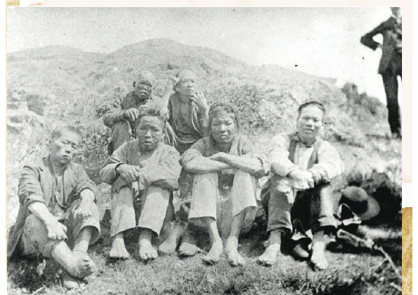
▲ 18世紀90年代被隔離在達西島的華裔癩瘋病人。

Asiatic Exclusion League）在市議會前示威。但和平集會很快演變成暴力騷亂。暴徒衝擊華埠以及日本城。