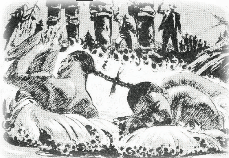
▲ 1887年的反華暴亂期間，相傳有華人的髮辮被綁在一起，丟進高豪港。圖為1960年 Macleans 雜誌插圖。

正當省府就歷史上對華人的不公義及錯誤舉措作出道歉之際，重溫這段省府為華人「仗義出頭」的歷史，或可讓讀者對歷史的曲折性，有更加全面的掌握。 明報記者陳志強