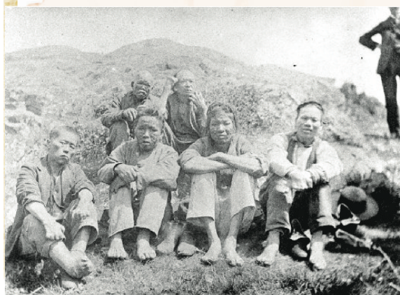
▲ 18世紀90年代被隔離在達西島的華裔癩瘋病人。

Asiatic Exclusion League）在市議會前示威。但和平集會很快演變成暴力騷亂。暴徒衝擊華埠以及日本城。