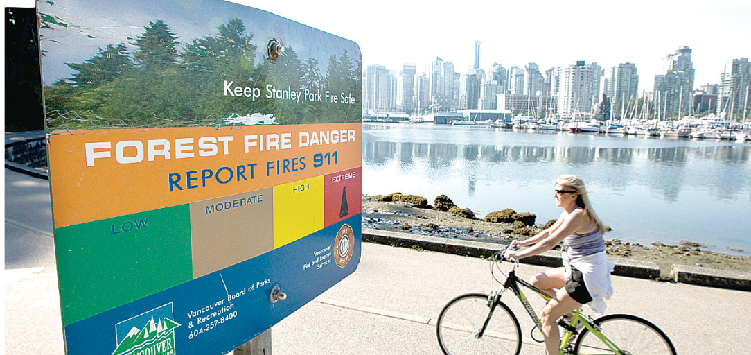
豎立在史丹利公園海牆(Stanley Park seawall)的林火警告牌顯示達「極危」(extreme)等級，極之酷熱和沒有降雨的天氣預測使不少卑詩民眾高度戒備，在林地帶尤其小心。

門的車內溫度10幾分鐘即可飆升到40至50度，一旦嬰兒或寵物被反鎖在內會相當危險。該組織近日每天接到約2000個各類緊急求救電話，比正常時間上升了1成。