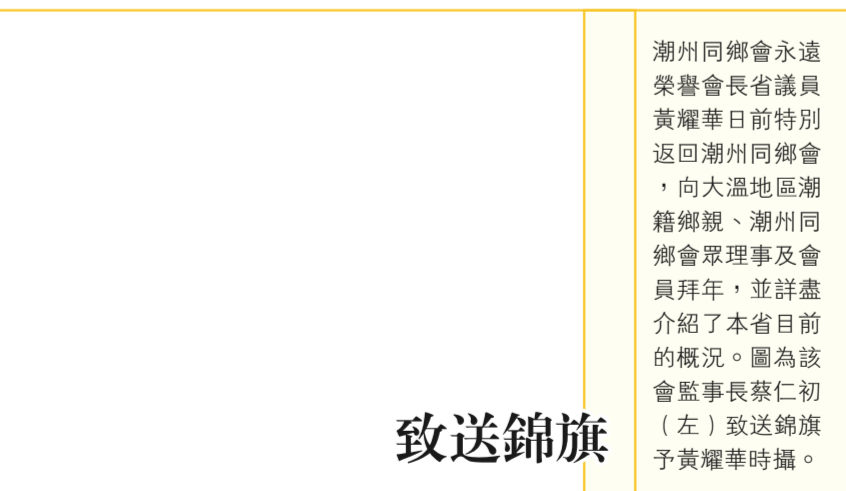
潮州同鄉會永遠榮譽會長省議員黃耀華日前特別返回潮州同鄉會，向大溫地區潮籍鄉親、潮州同鄉會理事及會員拜年，並詳盡介紹了本省目前的概況。圖為該會監事長蔡仁初(左)致送錦旗予黃耀華時攝。

省議員黃耀華則說，從趙松基榮獲女皇金禧紀念勳章這件事來看，就可以說明溫哥華趙氏宗親會在社會上發揮了巨大的作用。黃耀華更代表卑詩省政府向溫哥華趙氏宗親會頒發了獎狀。