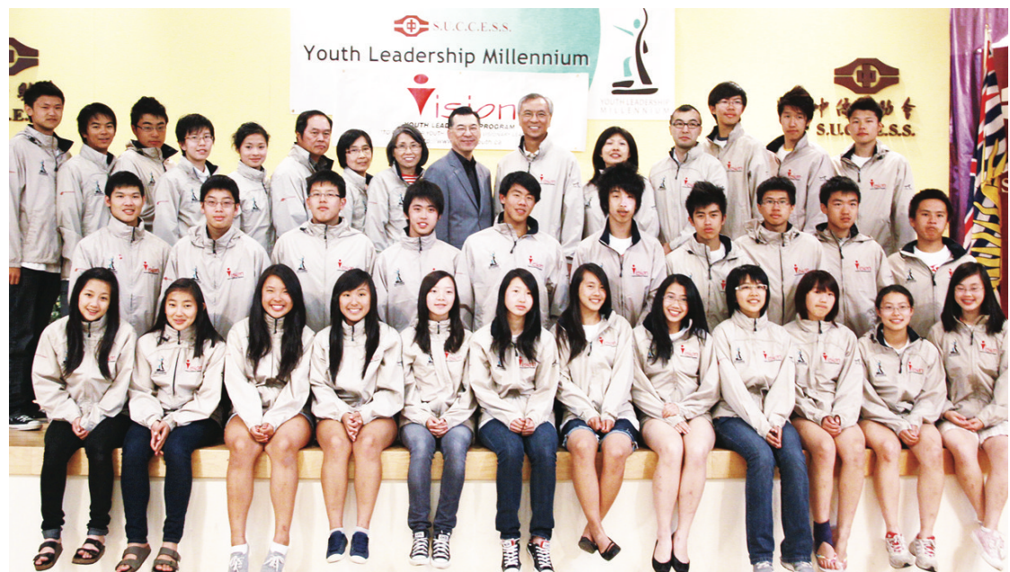
交流活動的全體青年合影，成員們約有半數來自東岸，餘下則來自卑詩本地。