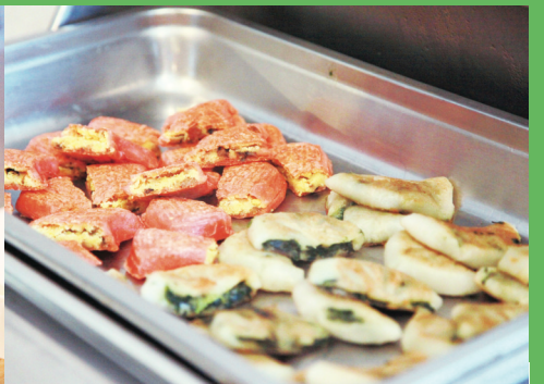
主辦方昨日展示了其中數種傳統潮汕美食，並邀茶藝專家講解演示潮州茶道。