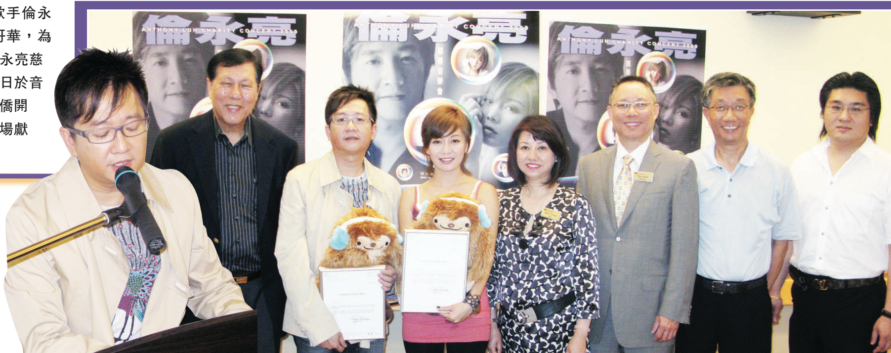
▲胡以鈞（右二）及中僑基金會成員向倫永亮（左二）及胡琳（左三）頒發紀念品，感謝他們百忙中抽空到溫哥華，為中僑長者服務籌款。 ▲倫永亮在參觀中僑李國賢護理安老院期間即場獻唱，為院內長者帶來驚喜。

受安老院歡樂氣氛感染，倫永亮更即場自彈自唱表演，向在場長者獻上60年代著名樂曲《相思河畔》。倫永亮表示，他與胡琳將在今晚的音樂會獻唱20多首，跨年代的中英文經典金曲，當中包括他個人的首本名曲如《你知道我在等你嗎》及《總有你鼓勵》等。他還透露，為配合現場反應，將會臨時加插其他音樂表演節目，保證為現場觀眾帶來驚喜。