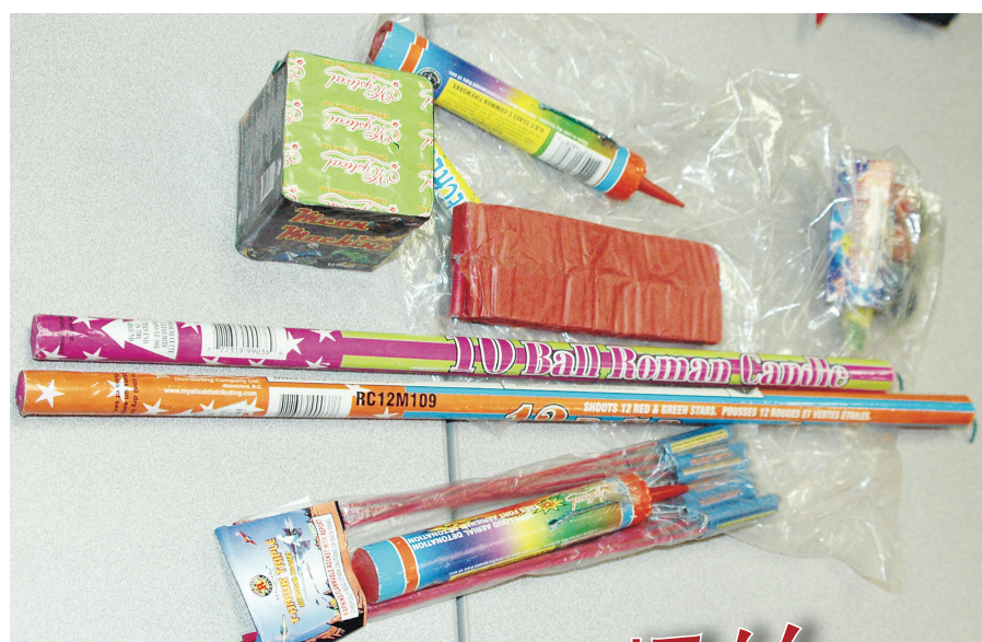
兒童醫院提醒家長,萬聖節必須小心處理爆竹,圖中為禁止燃放的數款煙火爆竹產品。(資料相片)

詳情參考綠色文化網站www.greenclub.bc.ca,諮詢請電604-327-8693。