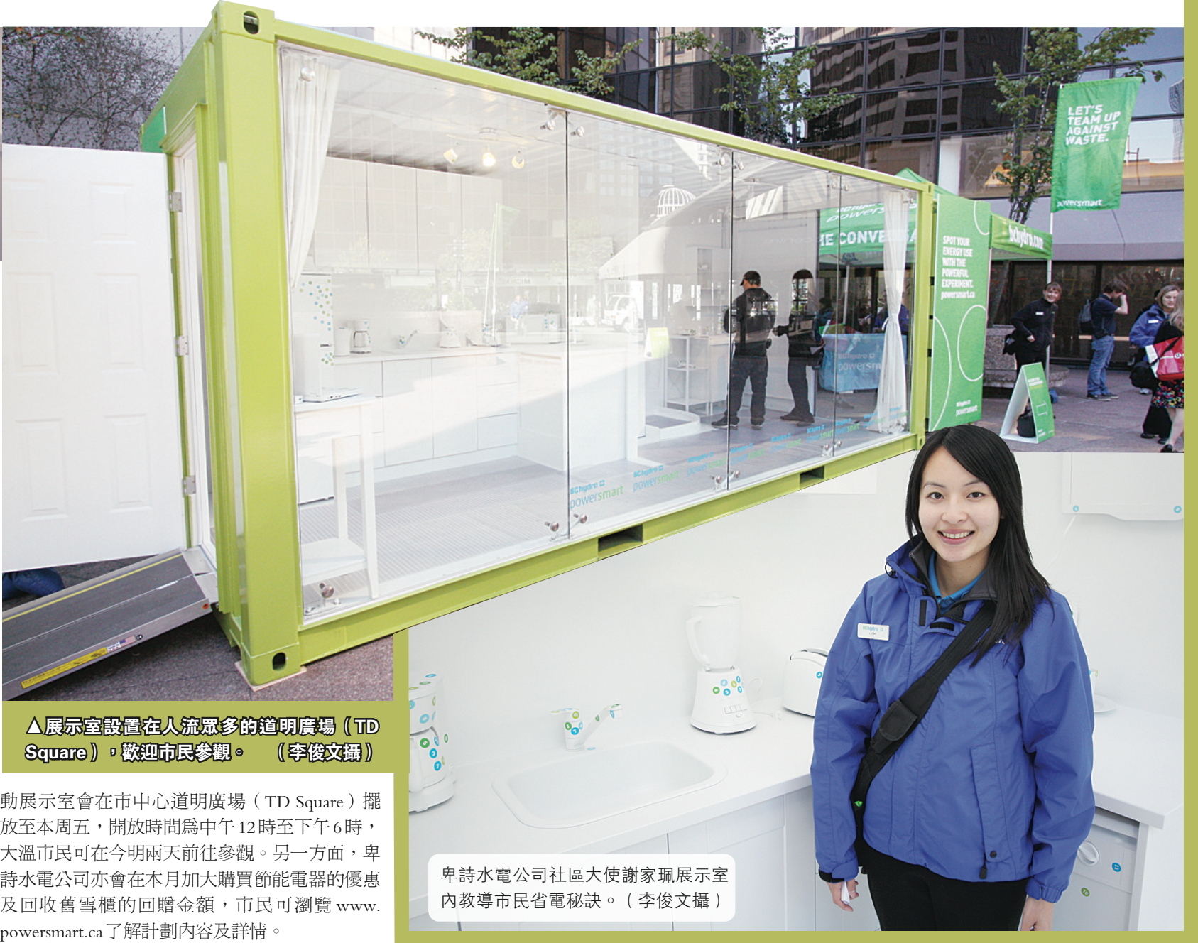
▲展示室設置在人流眾多的道明廣場 (TD Square), 歡迎市民參觀。