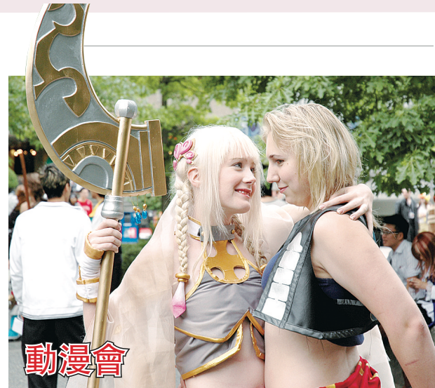
本地動漫迷年度盛會Anime Evolution從昨日起到周日，在卑詩大學學生活動中心舉行。每年這個活動均吸引逾千人參加，其中不少人會cosplay，花幾個月的時間精心製作服裝，將自己打扮成漫畫人物模樣。

隨團出訪的還有加拿大亞太總裁協會、華埠商會、華埠商業促進會、振興華埠委員會的代表。