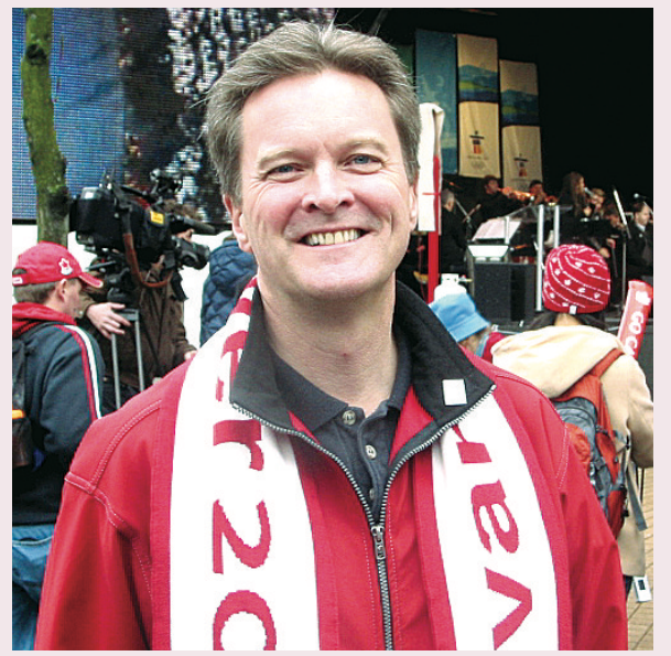
韓仕新指，將冬奧帶來的建設與機會，成為全省社區和商業的遺產，是卑詩省首要目標。

韓仕新強調，卑詩省商貿代表團在北京取得成功，希望將這股氣勢帶回卑詩省迎接2010冬奧。最重要是向世界展示，卑詩省是生活、工作、玩樂及投資的最佳地方。