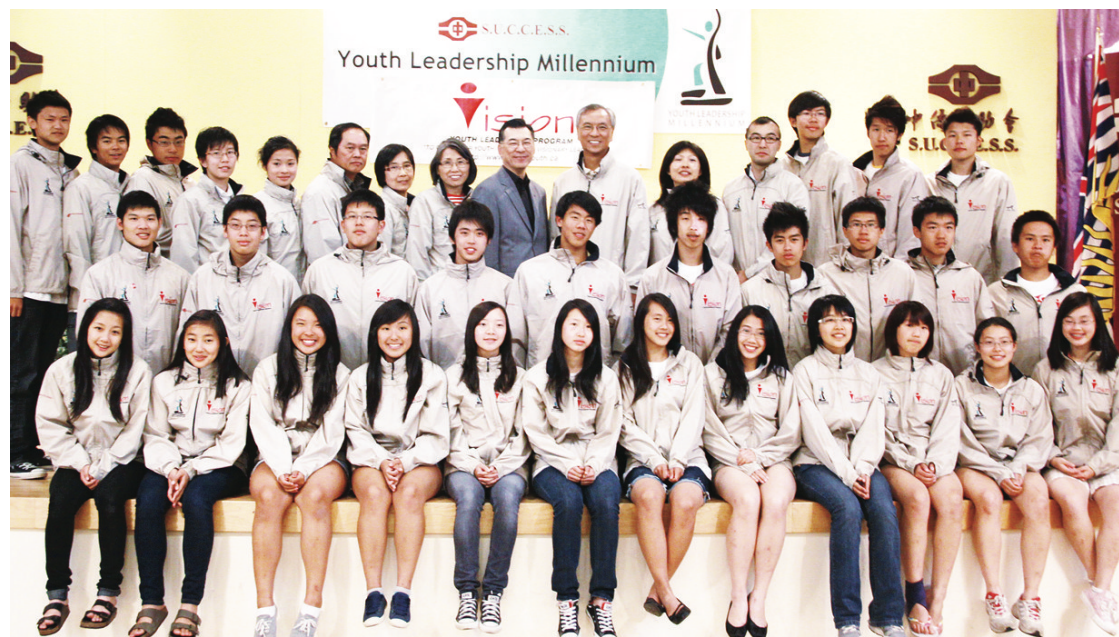
交流活動的全體青年合影，成員們約有半數來自東岸，餘下則來自卑詩本地。

族裔成員，而且即便同為華裔，也都有新移民或本地出生、說國語或粵語等諸多差別，因此在交流過程中，青年們仍有極多互相學習的空間。