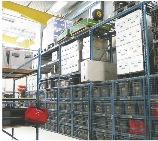
▲中心內儲備的緊急救援設備及物資。 ◀消防員正在可控制火火大樓進行訓練。

（Heavy Urban Search and Rescue Team，簡稱HUSAR）、加拿大第一專責小組（Canada Task Force - 1）的主基地，類似這樣的救援隊伍，全加僅有4支。 戈米克強調，由於是HUSAR的主基地，而HUSAR又是能在任何情況下支援全球任何地方的救援部隊，中心內有一個巨型倉庫，儲備必要的救援設備、工具、食物、醫藥等物品，公眾可於開放日當天免費進倉庫參觀，還有專業人士回答疑問，肯定能滿足不少成年人和小朋友的好奇心。 去年活動吸引大批市民參加，各景點的總參觀次數逾8600次，近200名義工參與其中。溫