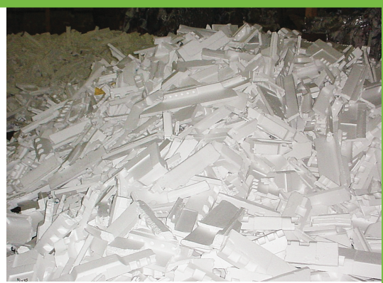
為應付聖誕節所產生的大量發泡膠廢物，本那比將設臨時回收中心。

市民可將發泡膠送至設於Still Creek的臨時回收中心，回收體積若超3立方碼需付費，而商戶送交發泡膠，則須需付每立方碼6元的費用。該回收試驗計劃一年成本為3萬元，回收所得的發泡膠會被送往高貴林的處理廠，經處理後轉送外地循環再造，製成相框之類的再造物件。素里市及新西敏市亦有類似的計劃，實行後反應不俗，約翰斯頓稱若本那比的計劃成功，將考慮將回收規模擴大。