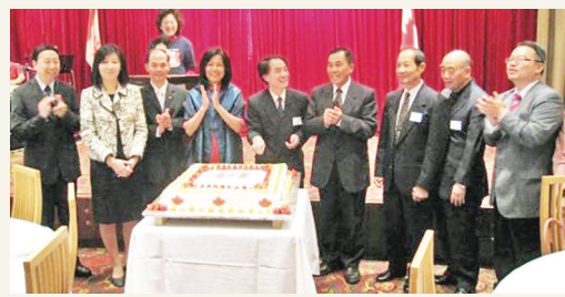
嘉賓們齊切生日蛋糕慶祝加拿大國慶。

蛋糕，舉杯祝福，隨即展開多元族裔文藝表演，台灣客家會的客家歌謠、溫哥華陶笛家族的優揚樂聲、很具特色的日本歌舞、二胡、國粵語及印尼歌謠唱等，讓與會民眾欣賞多元文化之美，愉快歡渡加拿大日。