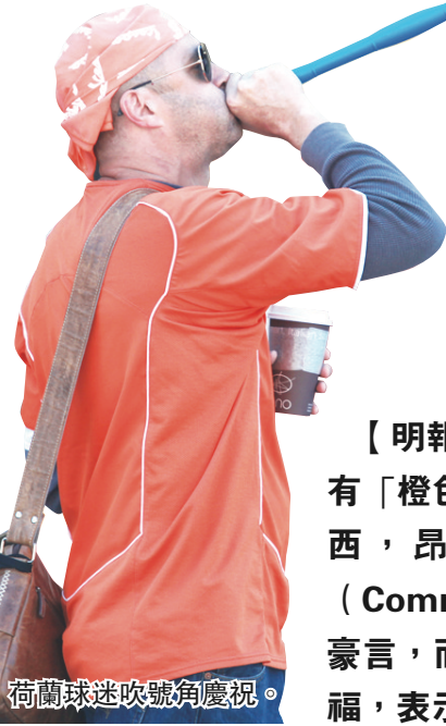
荷蘭球迷吹號角慶祝。

【明報專訊】南非世界盃足球賽昨日進行了兩場比賽，有「橙色軍團」之稱的荷蘭隊以2:1力克「森巴舞者」巴西，昂首挺進4強。很多荷蘭球迷在溫市商業街(Commercial Dr.)歡呼慶賀，更放出「荷蘭必奪冠」的豪言，而巴西球迷雖對比賽結果感到失望，卻大度送出祝福，表示「不論比賽輸贏，享盡足球的快樂才最重要！」