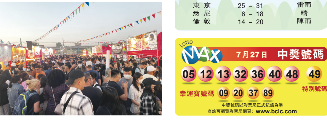
夜市擁擠的畫面在社交媒體上流傳。

據溫哥華沿岸衛生局表示，當局會向活動的主辦方提出有關憂慮，並建議主辦方實施更嚴格的防疫措施，包括限制售票、更明確地控制人流，以及更清晰和嚴格指示到訪者保持社交距離。