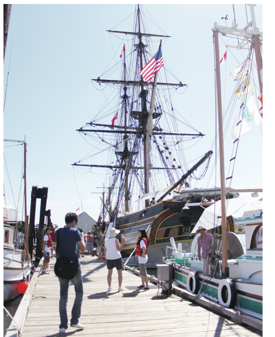
▶群衆可以沿長達190米的碼頭，逐個登上各個年代的船舶。