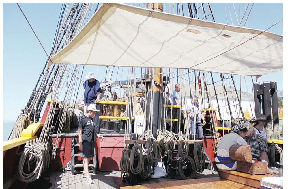
▼群衆可以登上高桅帆船Lady Washington參觀。(王冬樺)