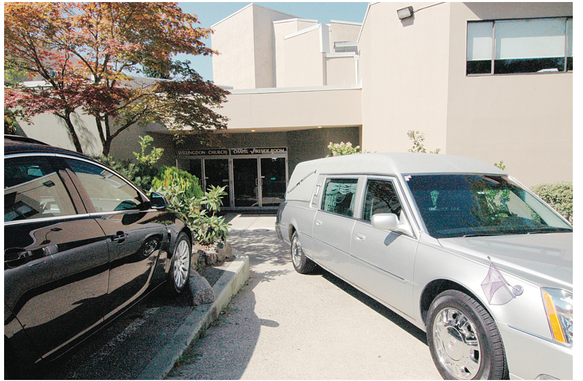
舉行喪禮的威靈頓教堂一片肅穆。

黃金煥1922年出生於溫哥華的唐人街，成長過程中飽受加拿大主流社會的排擠與歧視，但這並