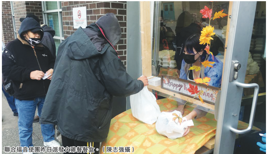
聯合福音使團昨日派發火雞餐餐盒。

自 1989 年以來，UGM 一直為溫哥華市中心東部需要幫助的居民提供感恩節晚餐，即使在新冠疫情流行期間也沒有中斷。