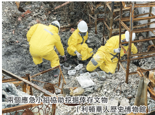
兩個應急小組協助挖掘倖存文物。(利頓華人歷史博物館)

利頓華人歷史博物館在今年 6 月 30 日被山火焚燬，館主早前曾表示，將善用「數碼概念」，重建博物館。