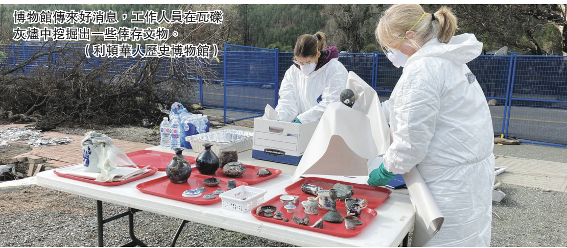
博物館傳來好消息，工作人員在瓦礫灰燼中挖掘出一些倖存文物。

【明報專訊】卑詩內陸利頓華人歷史博物館（Lytton Chinese History Museum）早前被山火焚燬，工作人員正在打掃災場，在瓦礫灰燼中挖掘到一些倖存的文物。