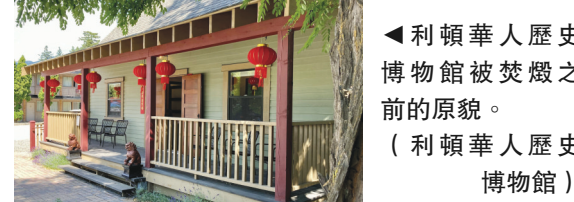
▲利頓華人歷史博物館被焚燬之前的原貌。