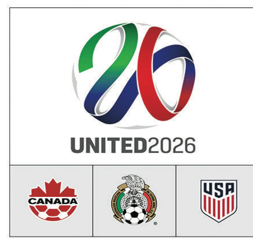
BIDDING NATIONS CANADA • MEXICO • UNITED STATES 聯合申辦委員會申辦 2026 年世界盃的標誌。

他續說：「但現在，來到 2021 年，我們處於一個完全不同的主辦城市。我們從全球大流行中走出來，我們的旅遊業在過去 16 個月所受到的衝擊，可能比其他任何行業都大。邀請世界於 2026 年來到溫哥華的前景突然有了全新的意義——不只為了足球充滿熱情民眾，也為了一些人想有機會去重新認識卑詩省，尤其溫哥華壯麗景色的世界。」