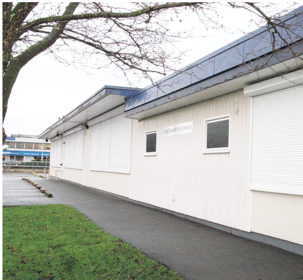
位於列治文東的Mitchell小學，為其中一間設EFI幼稚園及第1班的學校。

報告指，全校區本學年一共有245個第1班EFI學位，但扣除升班及兄弟姐妹獲優先取錄的學生人數後，實質只能額外供應42個，但申請人數則有52個。