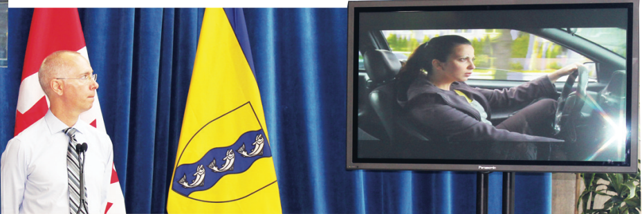
▲拉塞爾播放避免分心駕車的宣傳影片。 ◀馬保定宣布警方在本月會加強打擊分心司機。