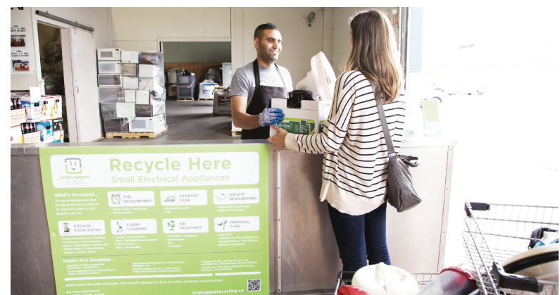
下月1日起將有120種小型家電，被納入可回收物品，屆時民眾購買這些電器需繳付回收費。