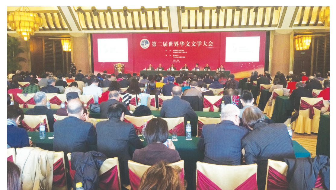
第二屆世界華文文學大會日前在京閉幕。