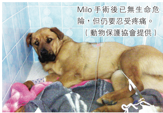
Milo 手術後已無生命危險，但仍要忍受疼痛。