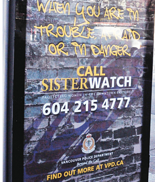
▲張貼巴士站的巨型海報，上有婦女求助專線。 ◀顯示有求助電話的流動電子板。

警方也製作求助電話資料卡，在不同地點和社區派發。這計劃會直至明年4月才結束，支出約25萬元。朱小孫強調，警方將致力打擊暴