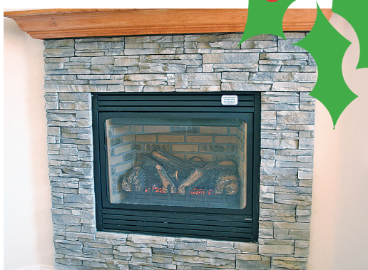
兒童醫院提醒，壁爐表面的玻璃溫度高達攝氏200度，父母應防範幼童被燙傷。

在他們體內亦會發生化學反應；確定把電視機放在安全、穩固的地方，避免幼童被其砸傷，加國每年有超過100名幼童被倒下的電視壓傷而需要到急症室求醫；當使用天然氣壁爐時，壁爐表面的玻璃溫度高達攝氏200度，父母應防範幼童被燙傷；去親友家作客時要避免幼童被新奇的物品吸引，不慎吞下有毒物體、或是發生窒息等意外；含有酒精的飲品、硬糖果及堅果等要放置在幼童不可碰觸到的地方；避免幼童接近有毒植物如冬青樹等，如果他們碰觸或吞食植物，會引起中毒、咳嗽；確保室內禁