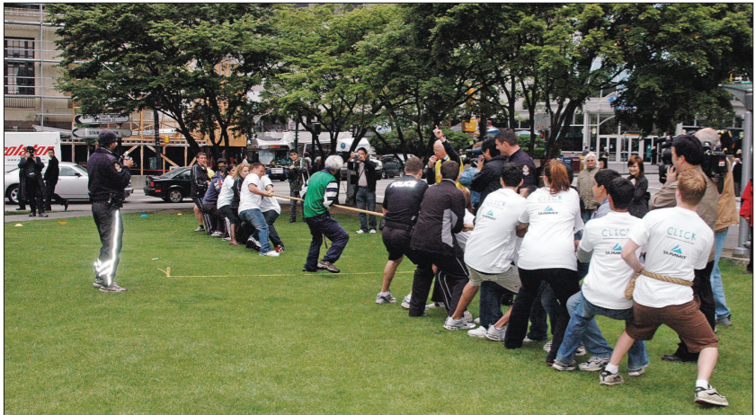
溫哥華多名市警參與拔河比賽，為協會籌款揭開序幕。