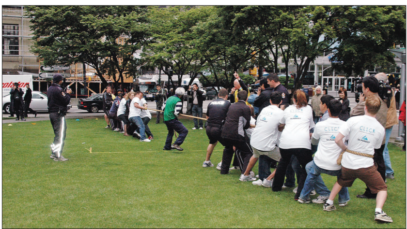
溫哥華多名市警參與拔河比賽，為協會籌款揭開序幕。