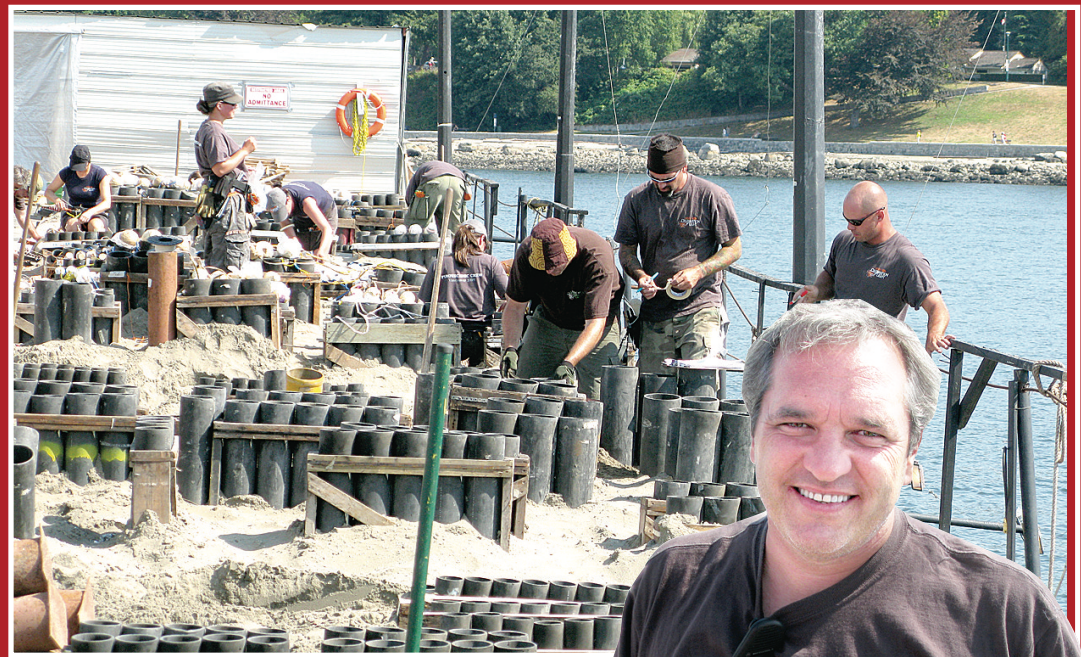
工作人員連日趕工，於多個不同大小的炮台內裝入 2800 枚煙花，準備於今晚將英吉列灣化身成「魔幻之窗」。

為這次煙花匯演準備了超過 2800 枚煙花的煙花製造商左控海表示，以色彩斑斕聞名世界的