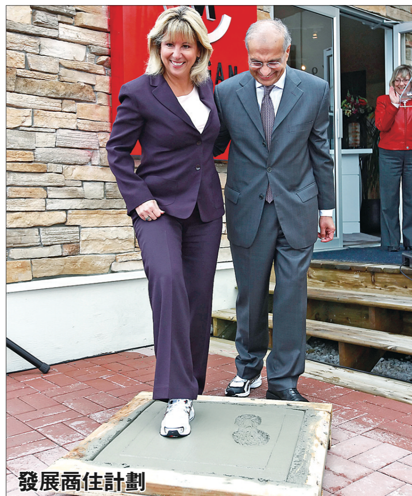
發展商住計劃 素里市長沃茨(Dianne Watts)昨日在一塊預製水泥板上，印下腳印，標誌着由公司 Larc Investments 在素里發展的 Morgan Crossing 商住兩用計劃，進入另一期工程。Morgan Crossing 將集居住、購物、飲食及文娛康樂於一處，商店都在步行可及的範圍之內。