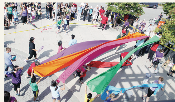
舞者突然在史蒂夫斯頓村漁人碼頭跳起彩帶舞，給市民意外驚喜。

【明報專訊】列治文藝術中心(Richmond Arts Centre)昨日舉行了3場別開生面的「快閃族」(Flash Mob)表演，數十名舞者在市內知名景點突然出現，表演短暫的團體舞蹈後隨即一哄而散，且行程完全沒有預告，以驚喜又意外地將藝術帶入民衆生活。