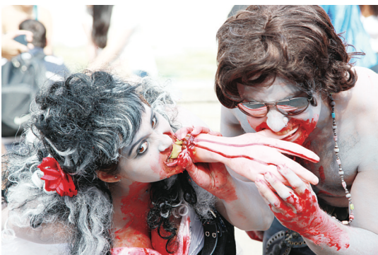
▲食人的恐怖情節，也是「喪屍」必備。