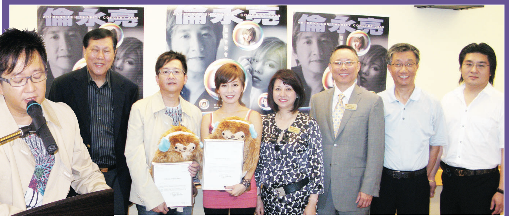
▲胡以鈞（右二）及中僑基金會成員向倫永亮（左二）及胡琳（左三）頒發紀念品，感謝他們百忙中抽空到溫哥華，為中僑長者服務籌款。 ▲倫永亮在參觀中僑李國賢護理安老院期間即場獻唱，為院內長者帶來驚喜。

受安老院歡樂氣氛感染，倫永亮更即場自彈自唱表演，向在場長者獻上60年代著名樂曲《相思河畔》。倫永亮表示，他與胡琳將在今晚的音樂會獻唱20多首，跨年代的中英文經典金曲，當中包括他個人的首本名曲如《你知道我在等你嗎》及《總有你鼓勵》等。他還透露，為配合現場反應，將會臨時加插其他音樂表演節目，保證為現場觀眾帶來驚喜。