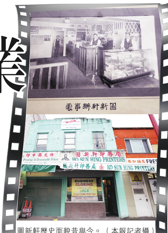
圖新軒歷史面貌昔與今。(本報記者攝)