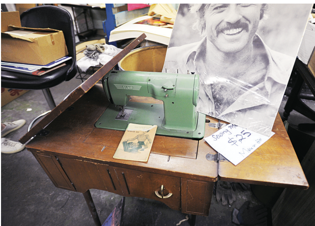
▲售價25元的古老衣車被餐廳東主買去作陳列品。