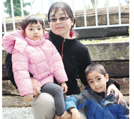
王太已是第二年坐迷你火車。