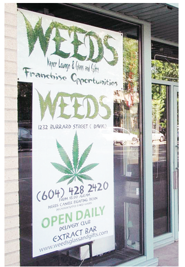
藥用大麻店愈開愈多，居民憂影響治安。

據報道，溫市目前內已有約80間藥用大麻店，比市內的Tim Horton's的咖啡店數目還要多。