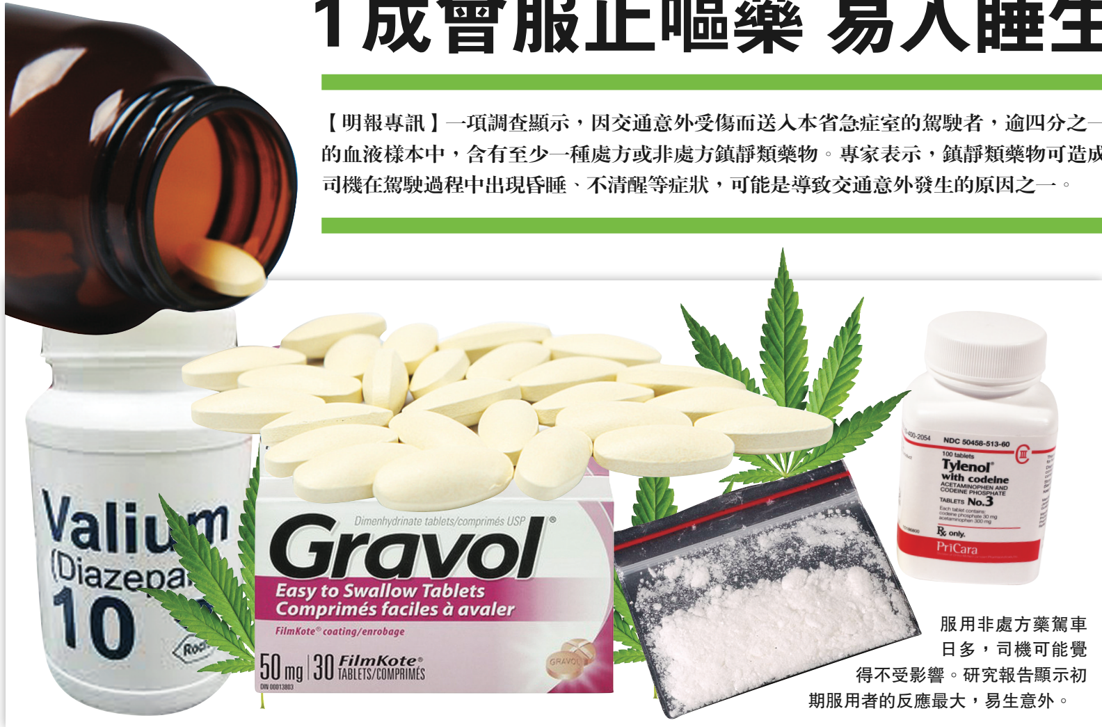
服用非處方藥駕車日多，司機可能覺得不受影響。研究報告顯示初期服用者的反應最大，易生意外。

【明報專訊】一項調查顯示，因交通意外受傷而送入本省急症室的駕駛者，逾四分之一的血液樣本中，含有至少一種處方或非處方鎮靜類藥物。專家表示，鎮靜類藥物可造成司機在駕駛過程中出現昏睡、不清醒等症狀，可能是導致交通意外發生的原因之一。