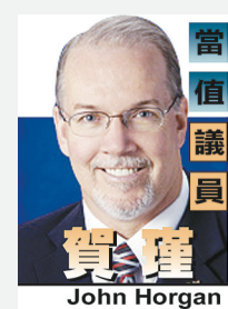
當值議員 賀瑾 John Horgan

隨着夏天即將來臨，本省許多年輕人將開始尋找工作。不論是尋找夏季短期工作，或是高中、專科、大學畢業生投入職場，都將面臨本省艱難的就業市場。今天，卑詩省3萬4千名年輕人失業，正在尋找工作，隨着另外9千名年輕人投入夏季工作市場，失業數字預期會更高。