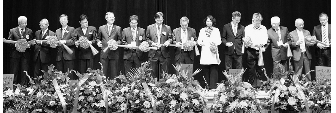
嘉賓為100周年慶典剪彩。