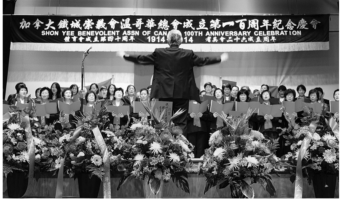
三地會員合唱會歌。

昨日的慶典儀式上，各方代表紛紛祝賀溫哥華總會成立100周年，稱讚總會管理有方，更長年熱心公益、服務社區，多年來為服務大溫地區華人及團結僑社作出不懈努力和貢獻，是本地僑團