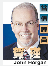
當值議員 賀瑾 John Horgan

隨着夏天即將來臨，本省許多年輕人將開始尋找工作。不論是尋找夏季短期工作，或是高中、專科、大學畢業生投入職場，都將面臨本省艱難的就業市場。