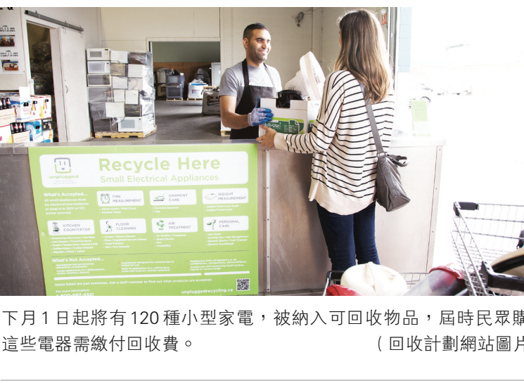
下月1日起將有120種小型家電，被納入可回收物品，屆時民眾購買這些電器需繳付回收費。