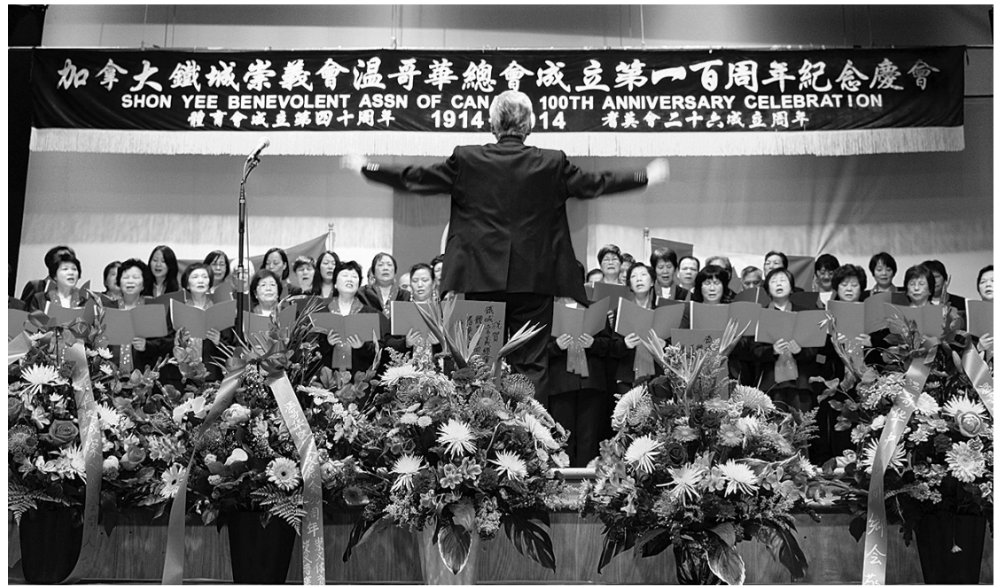
三地會員合唱會歌。

昨日的慶典儀式上，各方代表紛紛祝賀溫哥華總會成立100周年，稱讚總會管理有方，更長年熱心公益、服務社區，多年來為服務大溫地區華人及團結僑社作出不懈努力和貢獻，是本地僑團