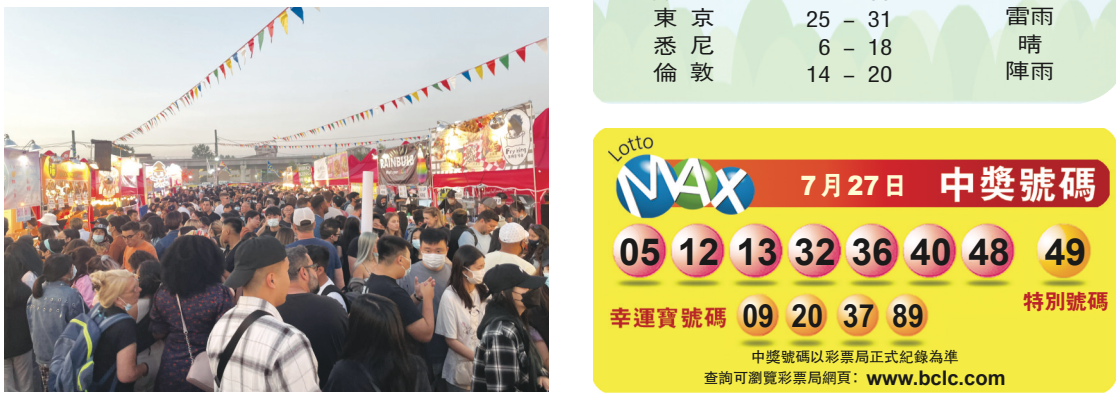
夜市的擁擠畫面在社交媒體上流傳。

據溫哥華沿岸衛生局表示，當局會向活動的主辦方提出有關憂慮，並建議主辦方實施更嚴格的防疫措施，包括限制售票、更明確地控制人流、以及更清晰和嚴格指示到訪者保持社交距離。