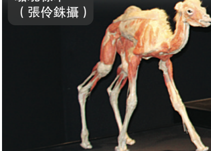
駱駝標本。 (張伶銖攝)