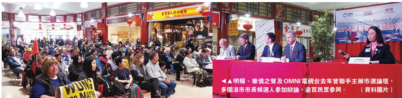
◀▲明報、華僑之聲及 OMNI 電視台去年曾聯手主辦市選論壇，多個溫市市長候選人參加辯論，逾百民眾參與。(資料圖片)

【明報專訊】明報、華僑之聲及 OMNI 電視台將於今明兩天舉辦兩場大選論壇，四個聯邦政黨，包括保守黨、新民主黨、自由黨及綠黨將會派出候選人，參加辯論及回答提問。