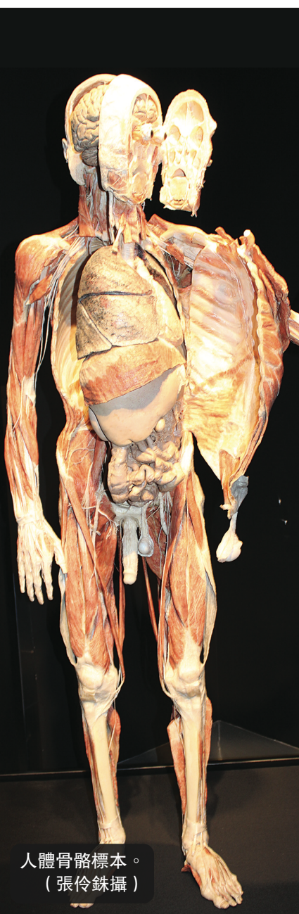
人體骨骼標本。

有關展覽收費及其他詳情，請上網至 www.scienceworld.ca/chinese 查詢。