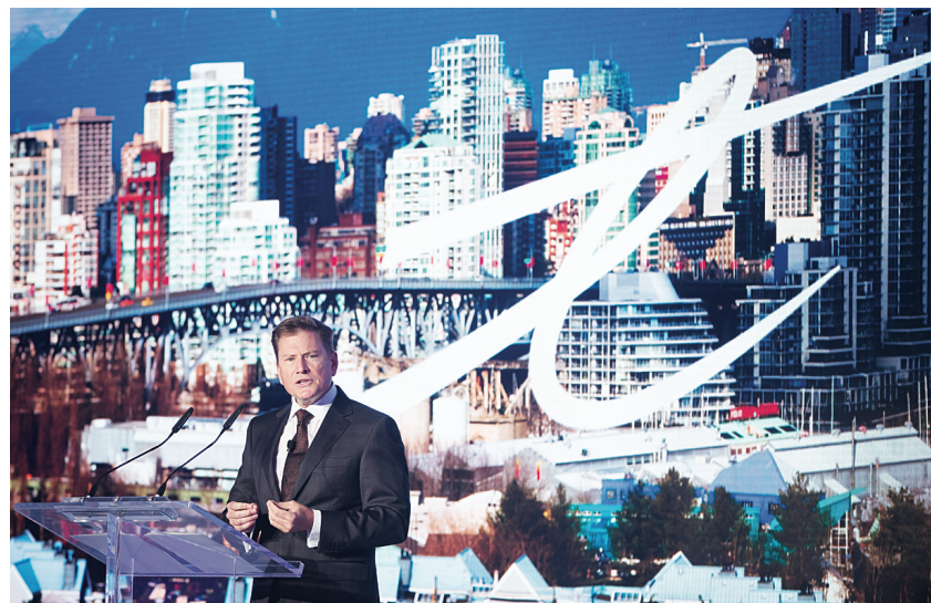
思特威爾公布投資10億元鋪設光纖網絡。

Telus 在本省包括高貴林港等22個城市社區安裝光纖網絡，並有計劃會在數個阿省和魁省城市，包括愛蒙頓安裝。