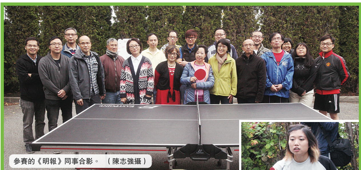
參賽的《明報》同事合影。