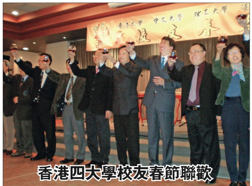
香港四大學校友春節聯歡

郵政大樓用了7,000公噸的鋼筋建築材料興建，工程耗資1,300萬元，於50年前落成的時候是全溫哥華市最抗震的建築物。50年後的今天，經歷多次翻新工程的大樓，設施雖然已經十分現代化，但仍然保留原有建築特色。於全球最大郵票繪圖旁邊的，便是溫市少數可讓直升機降落的指定地點，50年不變。