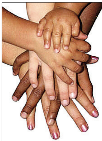
不同族裔的人將手疊在一起，以示反對種族主義，倡導族裔融合。(網上圖片)

「人人行動反對種族主義」活動由本省的WelcomeBC計劃所資助，後者是由省長金寶爾於2007年6月13日所宣布，大部分資金是聯邦政府根據《加拿大—卑詩省移民合作協議》提供。WelcomeBC活動旨在為本省的新移民提供需要的服務，幫助他們適應新生活。