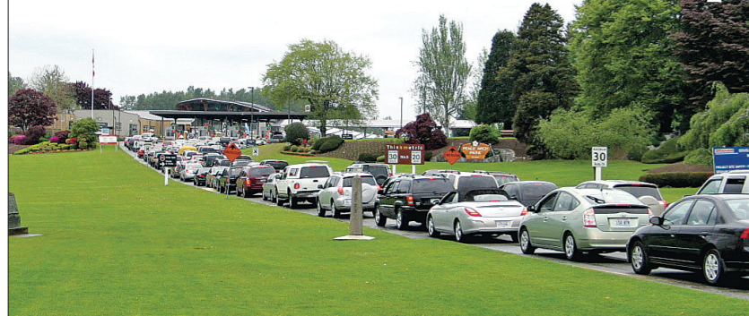
▲北上進入加國的車輛大排長龍。 ▼昨日下午，和平門關卡南下的車流並沒有出現大排長龍的情況，旅客亦不覺得工程會影響他們駕車出遊的意願，反倒是從美國北上進入加國邊境出現大塞車，等候通關時間較長。