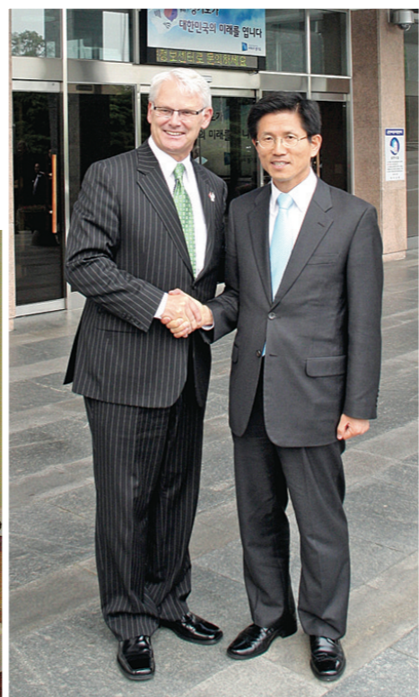
金寶爾（左）與京畿道省督Moon-Soo Kim（右）簽署姊妹省分條約。

與香港特區行政長官曾蔭權會面。蘇利文本周三（香港時間）將於香港總商會及加拿大總商會的會議