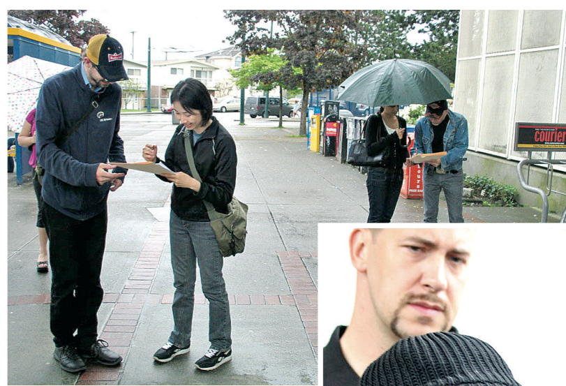
▲有義工昨在納奈莫空架列車站外蒐集請願簽名。 ▶戴特談到她遇襲的經驗，不禁悲從中來，站在後方的是湯納。

除了和平門南下有工程，北上在加國境內，亦有工程進行，雖然進入加國的行李檢查通道並沒有因工程而減少，但是車龍明顯較長，等候時間亦較久。