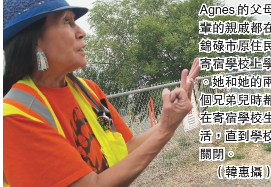
Agnes的父母和親戚都在錦碌市原住民寄宿學校住過。她和她兩個兄弟兒時都在寄宿學校生活，直到學校關閉。

探訪者在24日一大早驅車前往錦碌市。他們從當地人得知，當年錦碌市原住民和華人的關係非常友好和緊密。有原住民憶述，原住民從華人那裏學會了很多農業知識。有一年大年，華人教授的「引渠灌溉法」，讓原住民部落避免了饑荒。也有原住民表示，錦碌市的中國餐館是最喜歡光顧的地方，有回家一樣的感覺。