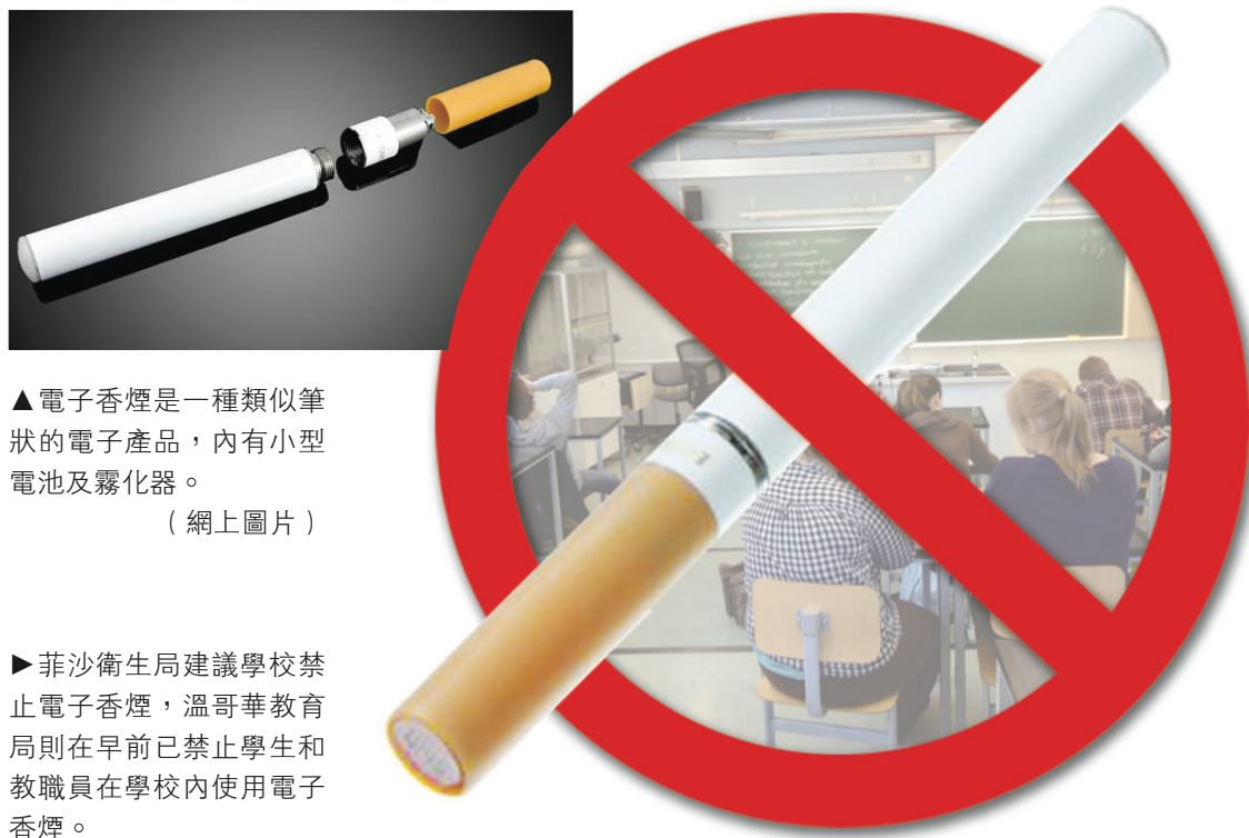
▲電子煙是一種類似筆狀的電子產品，內有小型電池及霧化器。

▶菲沙衛生局建議學校禁止電子煙，溫哥華教育局則在早前已禁止學生和教職員在學校內使用電子煙。