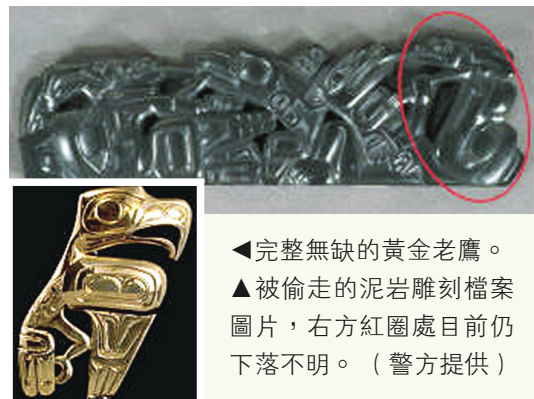
▲完整無缺的黃金老鷹。 ▲被偷走的泥岩雕刻檔案圖片，右方紅圈處目前仍下落不明。