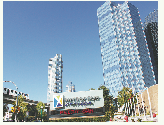
鐵道鎮商場位於南本那比選區，近來大量華裔人口移居該區。

前屆大選在本那比-道格拉斯選出的國會議員甘迺迪，此次選擇在南本那比參選，而不是在北本那比-西摩（Burnaby North-Seymour）參選，有認為應與南本那比傳統上有較多聯邦新民主黨的支持勢力有關。