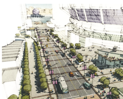
工程結束後，喬治亞街將新增一條四條行車線的地面馬路。