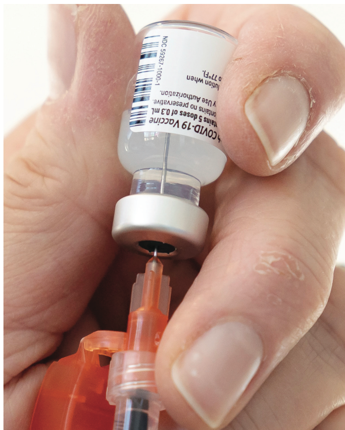
最新民調指卑詩省民大部分人強烈支持「疫苗護照」，並認為無論是國內外旅客都應提供此類證明。

不過，她認為「護照」一用辭不正確，因其猶如賦予遊客通過權，應以「證書」來稱呼。她續指，除了一些高風險地點如長期護理院或醫院，要求訪客出示已打針疫苗證明，此做法在道德上適當，但到餐廳、演唱會或其他大型活動，便不應有對個人有上述要求。不過，她指人們在疫期參加大型活動前，應該接種疫苗。