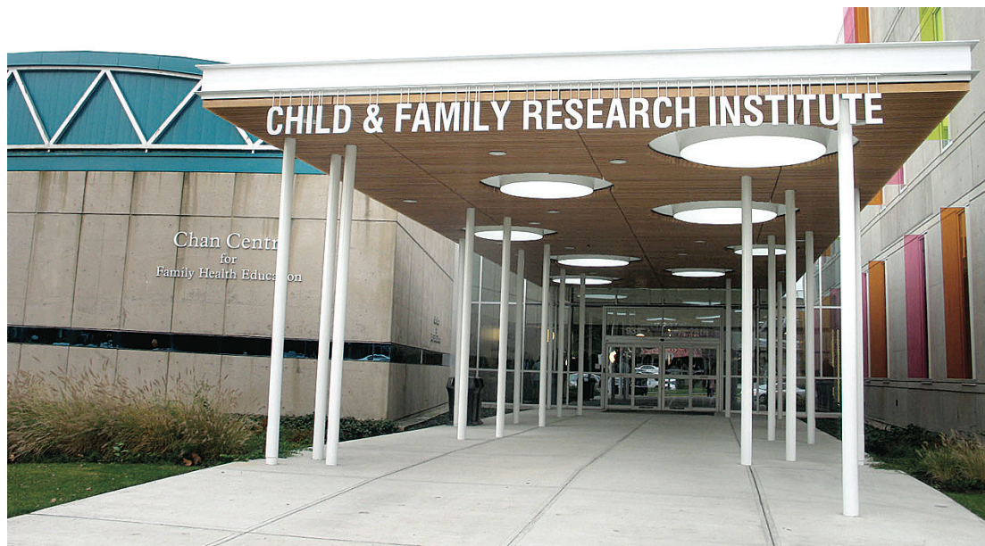
5層高的卑詩兒童與家庭醫學研究所大樓昨日落成啟用。(張伶鈺攝)

【明報專訊】卑詩省兒童與家庭醫學研究所(Child & Family Research Institute)大樓昨日正式落成，研究所大樓位於卑詩兒童醫院內，面積達12.1萬呎，共花費5810萬元興建，將吸引來自世界各地在兒童糖尿病、傳染病、免疫疾病、精神病及癲癇等領域醫學研究人員前來，提高卑詩省在兒童醫學研究領域的競爭力。